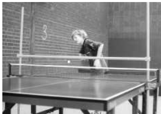
Aufschlagtraining - Der Ball soll möglichst flach zwischen Netz und Stange hindurch gespielt werden.

Weitere Hilfsmittel: Boden- und Tischmarkierungen, Berührungshilfen oder Netzveränderungen.