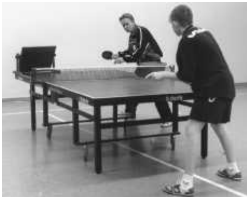
Balleimertraining mit dem Returnbrett